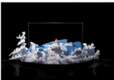
いのうえひでのり 演出『劇団☆新感線 RX 五右衛門ロック』 舞台美術模型 2015年 個人蔵