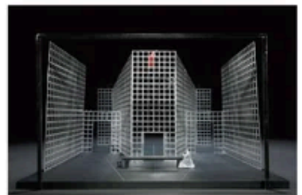
徳川幸雄 演出『リチャード三世』舞台美術模型 2015年 個人蔵