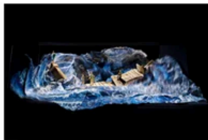
三谷幸喜 演出『三谷かぶき 月光露剣路日本 風雲児たち』 舞台美術模型 2019年 個人蔵