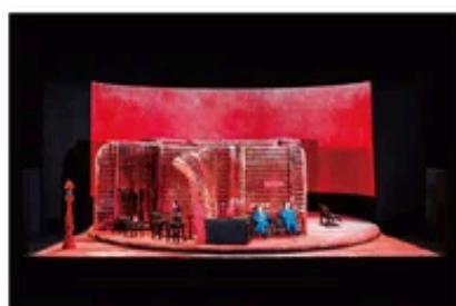
森新太郎 演出 ミュージカル 『ハンズ・ヴィジット 迷子の警察音楽隊』舞台美術模型 2023年 個人蔵