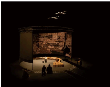
是枝裕和監督 映画『いしづみ』舞台美術模型 2018年 、個人蔵