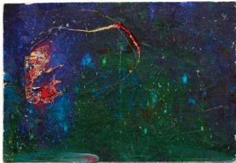
イメージ図 2025年 撮影：稲口俊太、個人蔵

堀尾幸男が本展オリジナルとして子どもたちのためにデザインした宇宙空間を1/1スケールで実現展示します。“舞台美術の魔術師”によって、約11m四方の元は白壁に囲まれた何もない空間が、暗い夜空にたくさんの星がきらめく無限の世界に変容しますする様をお見逃しなく。ぜひ皆さまが主役になって、この特別な舞台に立ってみましょう。