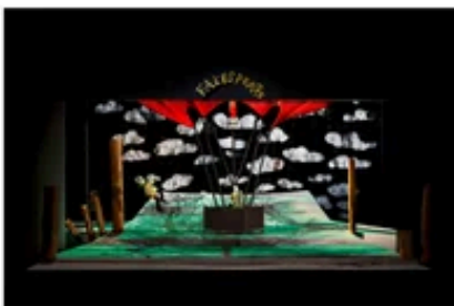
野田秀樹 演出『フェイスピア』舞台美術模型 2024年 個人蔵