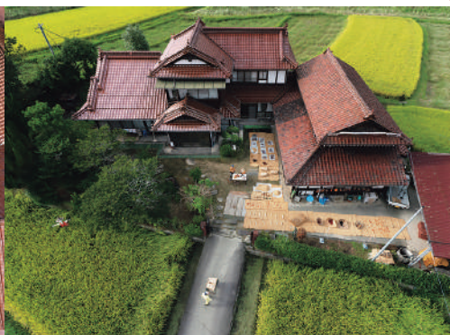
左：《前垣壽男・佳代 寿延庭 2024》2024 作家蔵 右：《中尾堯・純子 八本松 2024》2024 作家蔵