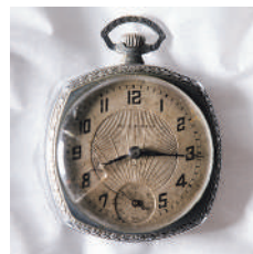
《8時15分》より 2024 作家蔵 ／懐中時計 寄贈：渡邊美代子 広島平和記念資料館

市制施行50周年の年度の最後となる本展では、現代において失われつつある記憶をもとに、この街の歴史に焦点を当て、奇しくも戦後80年を迎えるこの年に平和への想いを重ねながら、この街の未来を見つめます。