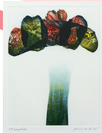
有地好登《Lampshade》2006年 エッチング、アクアチント、紙

絵の部分を彫り、その凹んだ部分にインクをつけ、プレス機で圧力をかけて刷り取る方法