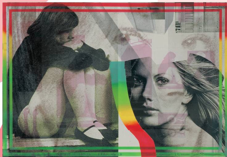
木村光佑《現在位置-フレーミングA》1971年 リトグラフ、シルクスクリーン、紙