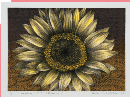
木下泰嘉《Sun flower-2022 (Ukraine)》2022年 リトグラフ、紙