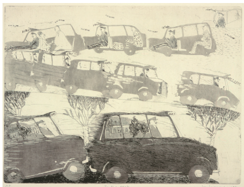
山本容子《To the Park》1978年 アクアチント、ソフトグラウンドエッチング、紙