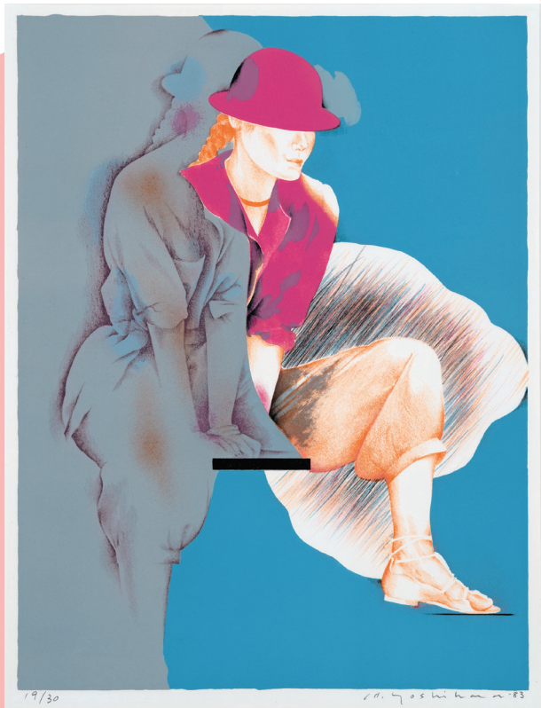
吉原英雄《SEPTEMBER》1983年 リトグラフ、紙 ©Hideo Yoshihara