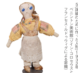
5 孫娘のために作った人形 1932年 ベントン美術館「フィン・コロセウスと フランセス・ド・ウイグ」による寄贈

*1,2,3,4 いずれも個人蔵(ギャラリー・セント・エティエンヌ、ニューヨーク寄託)すべて、アンナ・メアリー・ロバートソン・モーゼス