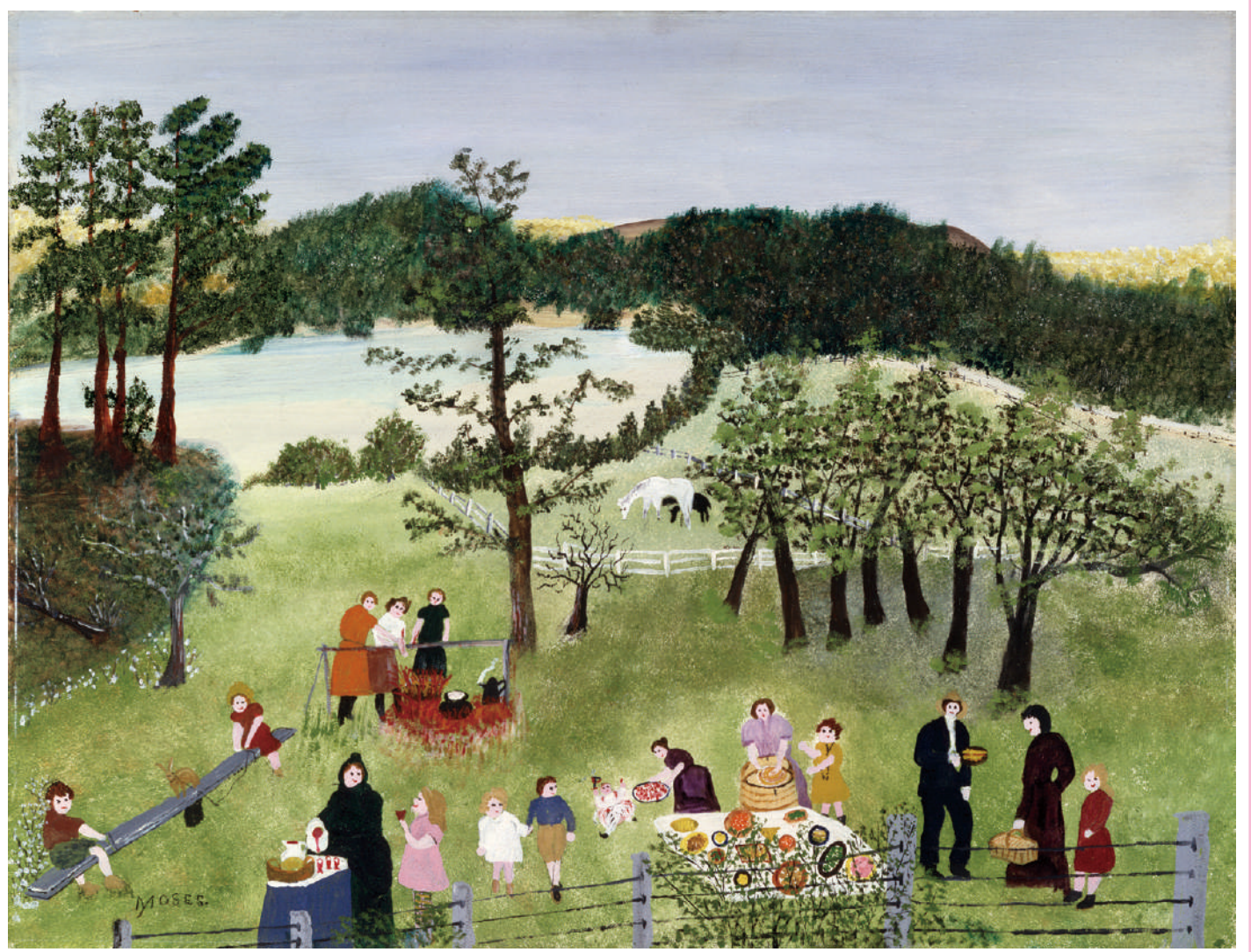
アンナ・マアリー・ロバートソン「グランマ・モーゼス《家族のピクニック》1951年 個人蔵(ギャラリー・セント・エティエンヌ、ニューヨーク寄託)© 2022, Grandma Moses Properties Co., NY