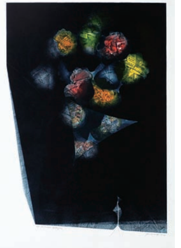
有地 好登 「Lost shape fantasy(s) (失われた形-白昼夢(s))」