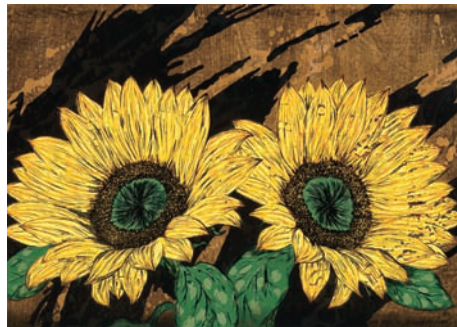
木下 泰嘉「GET BACK-109-Y」